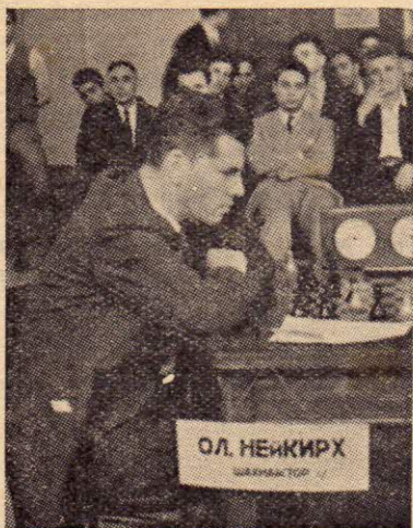
Шахмайстор О. Нейкирх, победител в търновския полуфинал

красивата партия на турнира. Груба грешка в тази партия и в партията със Станчев (5—6 кръг) му костваха 1.5 т. и той трябваше да се задоволи с по-скромно място. Изобщо „мителшпила“ на турнира Цветков не игра в пълната си сила и с напора на Нейкирх. Наред с Нейкирх Цветков ще се яви като един от най-сериозните кандидати за 1 място във финала на първенството.