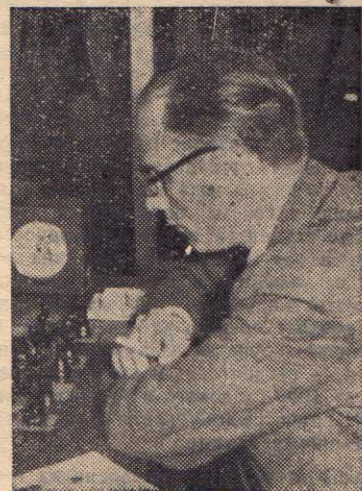
Шахмайстор д-р Ю. Тошев