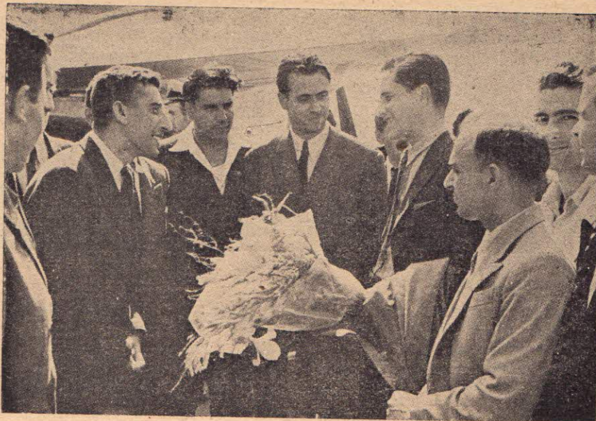
Посрещане на летище Враждебна

*** От гостуването на прославените съветски гротмайстори Керес и Бондаревски ние трябва да извадим сериозни поуки, както в организационно, така и в квалификационно отношение. Нашият шахматни комитети по места, особено в градовете посетени от съветските гротмайстори, ще трябва да използват нарастналия широк интерес към шахмата с цел да затегнат шахматните секции. Сега сигурно, вече по-малко ние ще можем да наблюдаваме случаи на подценяване шахмата от страна на отделни ръководители във физкултурни и други организации.