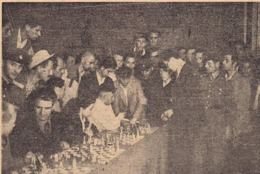
Сеанс на едновременна игра в Стара Загора

На следващия ден, след разглеждане старинната част на града, най-сърдечно бяхме изпратени от любезните домакини, които не пропуснаха случая още веднаж да изразят своята признателност, дарявайки гостите с възпоменателни подаръци, характерни произведения на нашия трудещ се народ.